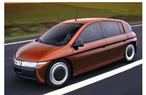
Photo ci-dessus : En 1995, le concept-car Renault NEXT est totalement révolutionnaire : un véhicule hybride familial doté d'un moteur thermique à l'avant et de deux « moteurs-roues » électriques à l'arrière. Il est capable de rouler à 165 km/h.

Photo ci-contre : la compagnie Detroit Electric (Michigan) produit à partir de 1911 des véhicules électriques dotés de batteries plomb-acide relativement aboutis, capables de parcourir 130 km à 32 km/h.