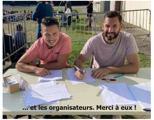
... et les organisateurs. Merci à eux !