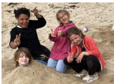
La journée d'intégration des sixièmes : les élèves sont allés à Port-Louis en Bateau !