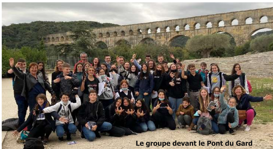
Le groupe devant le Pont du Gard