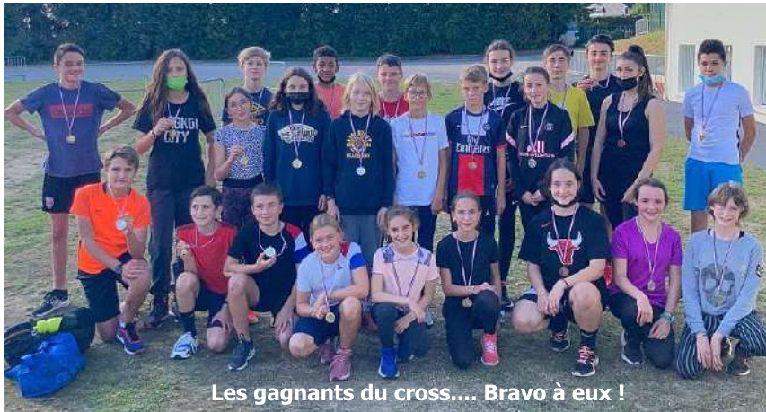
Les gagnants du cross.... Bravo à eux !