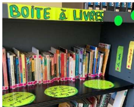
Une nouvelle boîte à livre en salle de permanence.