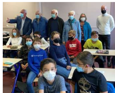
Rencontre intergénérationnelle lors de la "Semaine Bleue".