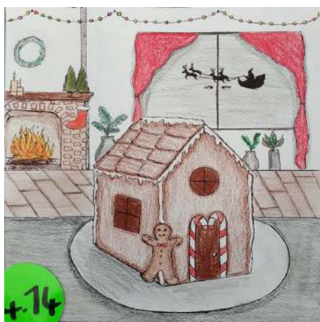
Bleuenn Le Ral - Le Boudouil (4B)