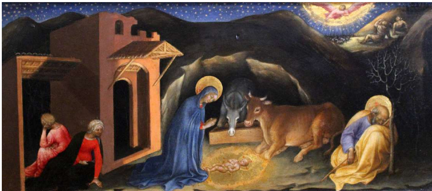
«Nativité» par Gentile da Fabriano, 1423, tempera sur bois